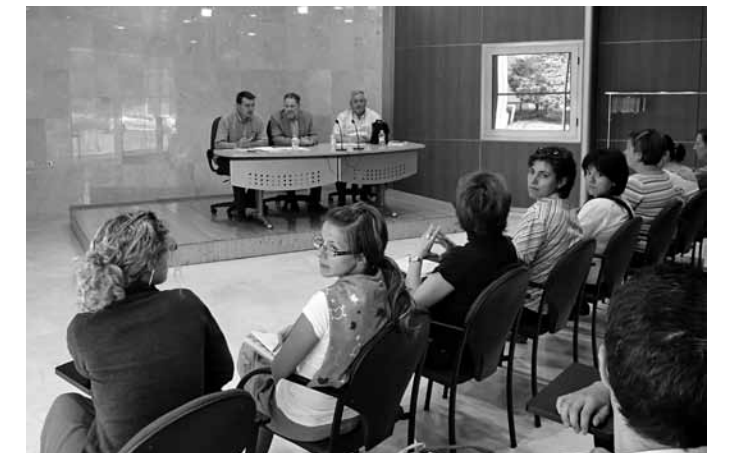
LA CONSTITUCIÓ DEL CONSELL ESCOLAR VA ESTAR PRESIDIDA PEL SR. ALCALDE

El Consell Escolar Municipal es constituïx com a instrument de participació democràtica en la gestió educativa que afecte el municipi i òrgan d'assessorament a l'administració competent, i serà l'encarregat de canalitzar les necessitats educatives dels diferents centres educatius i de la comunitat, elevant les oportunes propostes davant dels òrgans competents.