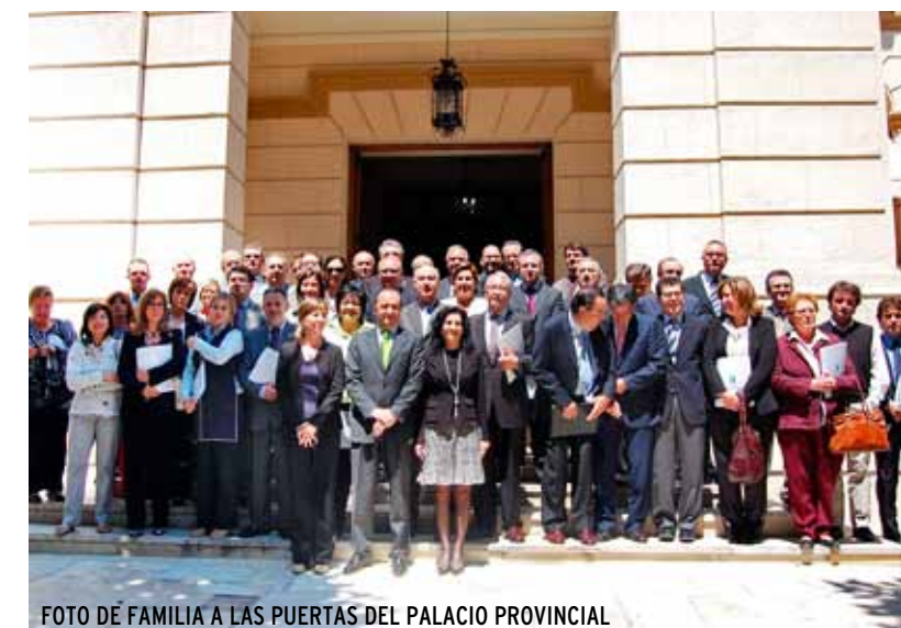
FOTO DE FAMILIA A LAS PUERTAS DEL PALACIO PROVINCIAL

El crecimiento del desarrollo económico-local en la provincia de Alicante y en sus comarcas vitivinícolas crea la necesidad de promocionar conjuntamente el nombre e imagen "Vinos de Alicante", y el desarrollo del producto denominado Enoturismo, a través de la acreditación de este territorio como "Ruta del Vino de España", consolidando el papel de Alicante como "Destino vitivinícola".