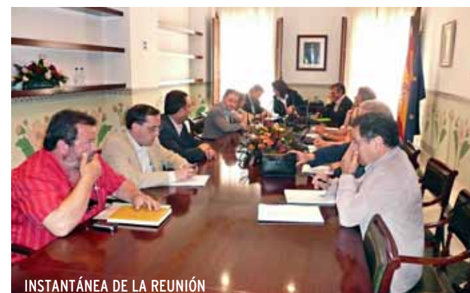
INSTANTÁNEA DE LA REUNIÓN

El consorcio intermunicipal del Pacto por el Empleo, compuesto por los ayuntamientos de la comarca y los agentes económicos y sociales más representativos de nuestro entorno, está trabajando para estudiar, planificar y ejecutar una serie de medidas que consideran necesarias para revitalizar el tejido económico y el empleo, de forma que sea posible mejorar el bienestar social de los ciudadanos de la comarca.