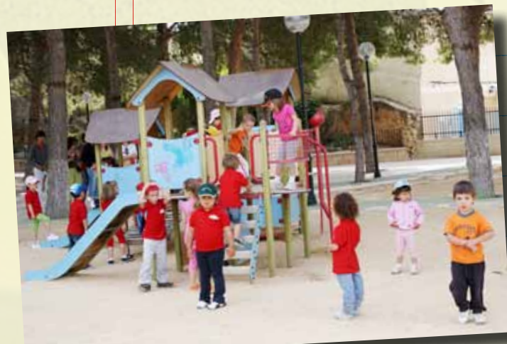
ELS ALUMNES MÉS XICOTETS VAN GAUDIR DE LA ZONA DE JOCS DEL PARC DE SANTA CATALINA