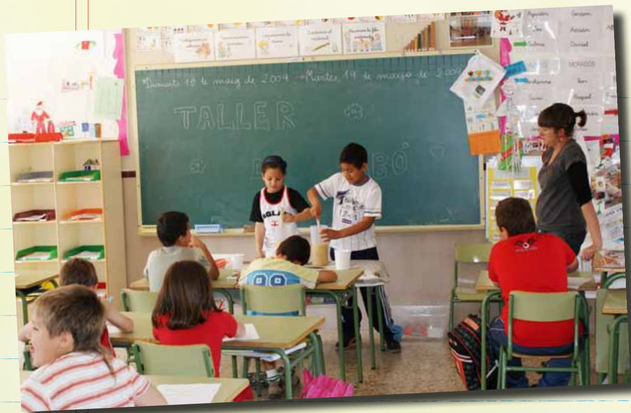
AL LLARG DE LA SETMANA ES VA FER UN TALLER DE SABÓ AMB ELS XIQUETS DEL 1ER CICLE