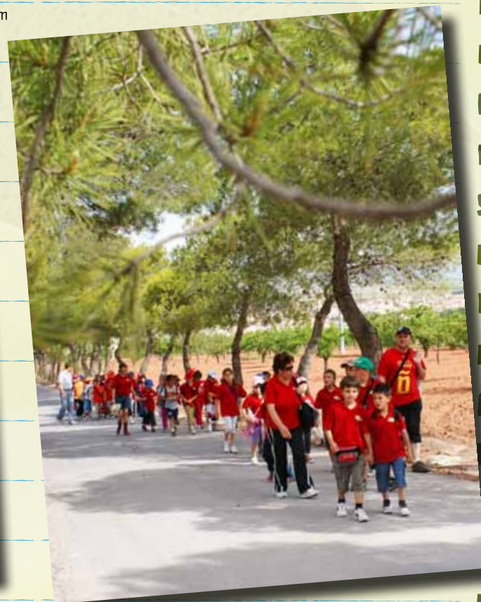
ALUMNES DEL 1ER CICLE PUJANT A LA FÀTIMA