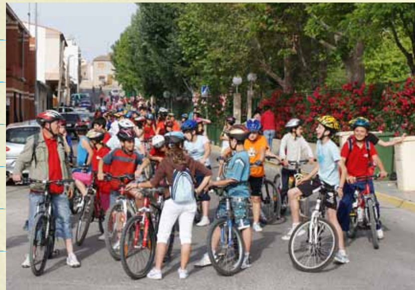
ELS ALUMNES MÉS MAJORS VAN ANAR AMB BICICLETA A LES ENZEBRES

Afegim la recepta del sabó per si de cas algú s'anima.